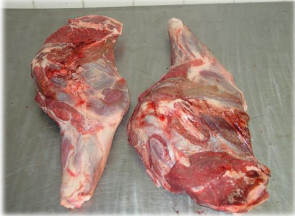
... podgardle, ...